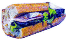
生ハムとカマンベールサンドウィッチ ¥600 (サニーレタス、生ハム、カマンベール)