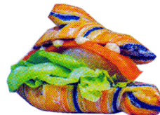
カラクロサーモン ¥600 (レタス、グレープフルーツ、スモークサーモン マヨネーズ、和風ソース)