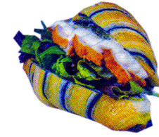
カラクロタンドリー ¥600 (レタス、タンドリーチキン ヨーグルトソース)