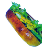
ホットドックエキゾチック ¥450 (レタス、ソーセージ、パイナップル とマスタードの甘酸っぱいソース)