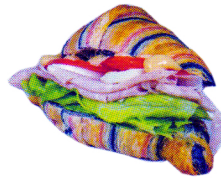
カラクロハム ¥600 (レタス、ハム、卵、トマト、マヨネーズ)